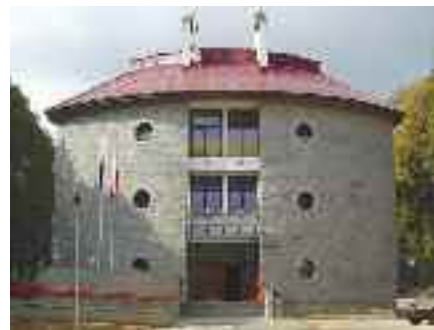
Gimnazjum w Pcimiu

Każda firma ma swoją specyfikę i prowadzi swoją politykę. W wielu li-