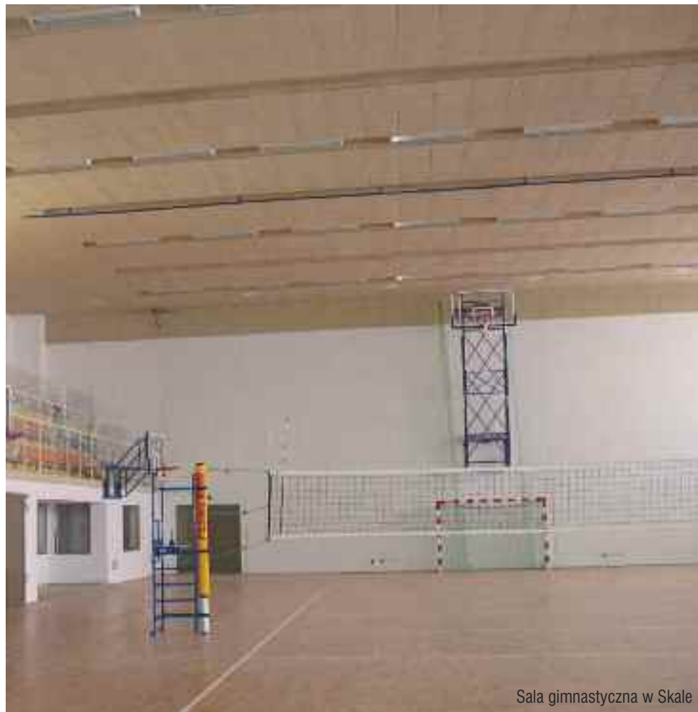
Sala gimnastyczna w Skale