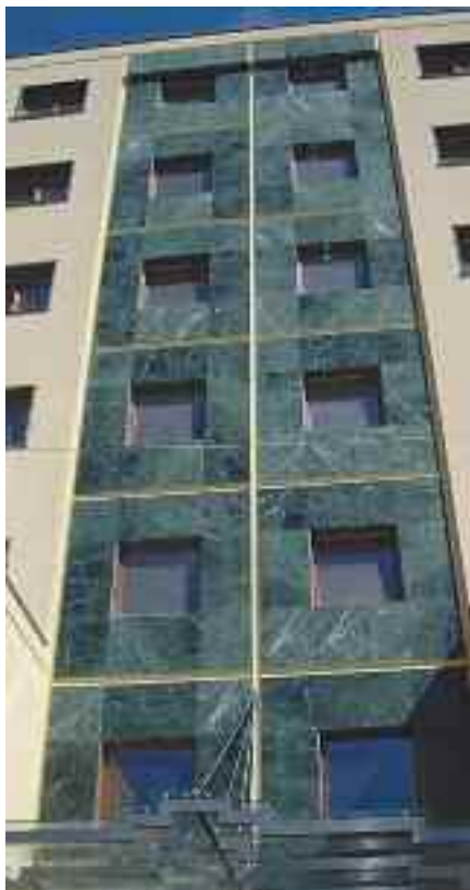
Budynek mieszkalny Bronowicka

Dokończenie ze str. 7 publicznych. Inaczej firmy będą się zarzynały w walce o zlecenia, stosując ceny dumpingowe. Mogą wpaść w pułapki, z których już nie wyjdą, pociągając za sobą cały łańcuch kooperantów. Nie do pozazdroszczenia jest wówczas sytuacja podwykonawców, którzy mogą liczyć na gwarancję zapłaty w przetargach publicznych, ale już nie w prywatnych. Uporządkowania wymaga także pojęcie ryczałtu, które w obecnym brzmieniu sprzyja nieuczciwej konkurencji i zwalnianiu inwestorów z rzetelnego przygotowania materiałów do przetargu.