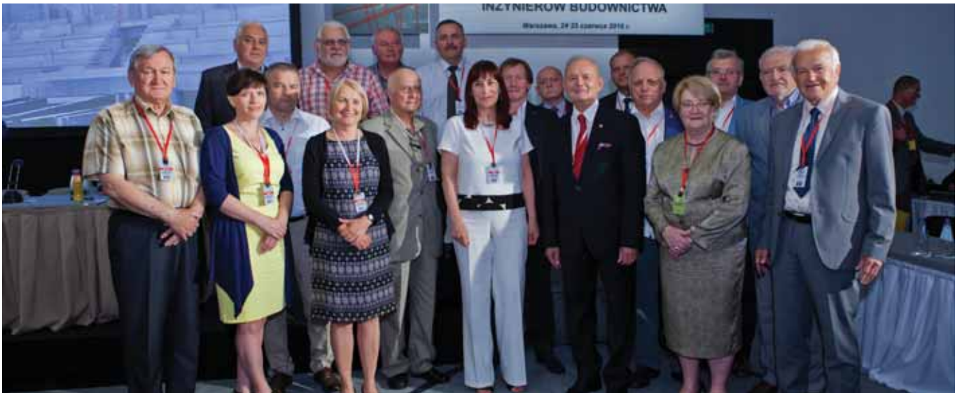
XV Zjazd 2016 r.