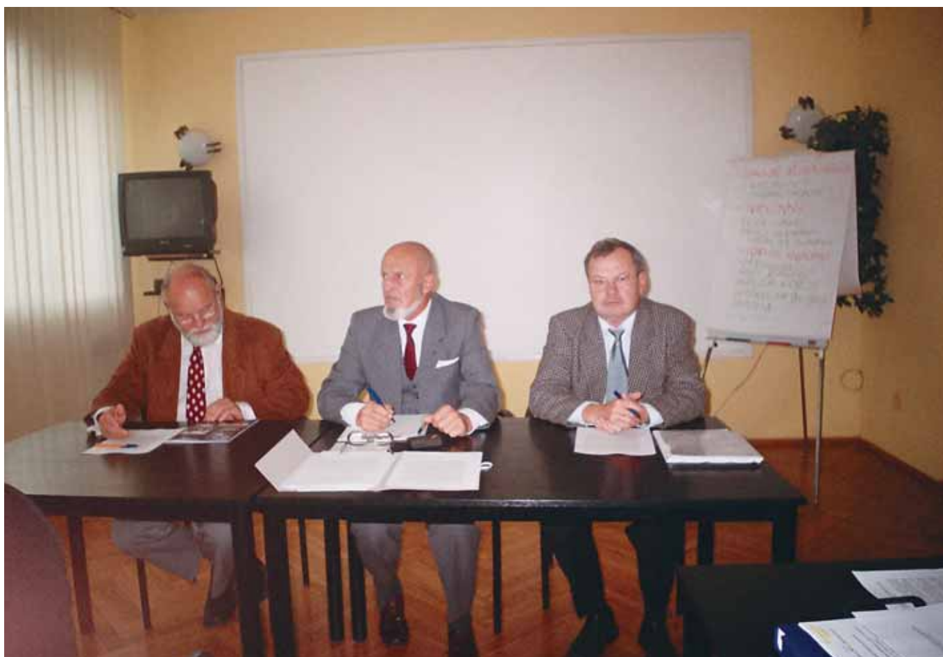
Warsztaty OROZ i OSD z Polski południowej - Osieczany 14.10.2005 r.