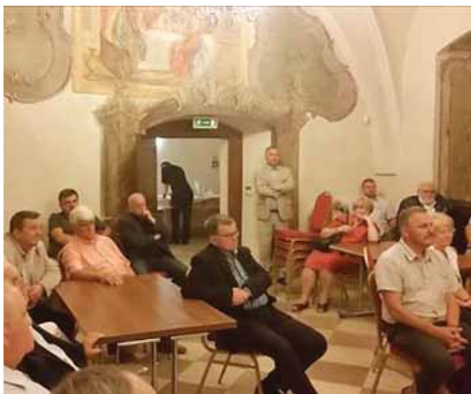
Rada MOIIB – Hebdów, 16.09.2016 r.