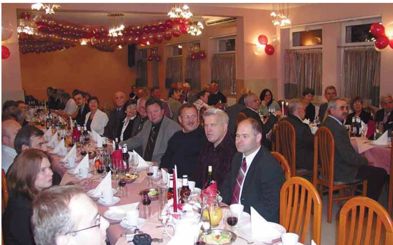
Szkolenie OROZ i OSD z Polski południowej - Sucha Beskidzka 16-18.10.2008 r.

W każdej kadencji członkowie sądu brali udział w szkoleniach i warsztatach umożliwiających uzyskanie wiedzy i znajomości przepisów oraz procedur (regulowanych przepisami prawa) oraz uzyskanie umiejętności prowadzenia postępowań dowodowych oraz rozpraw związanych z orzekaniem.