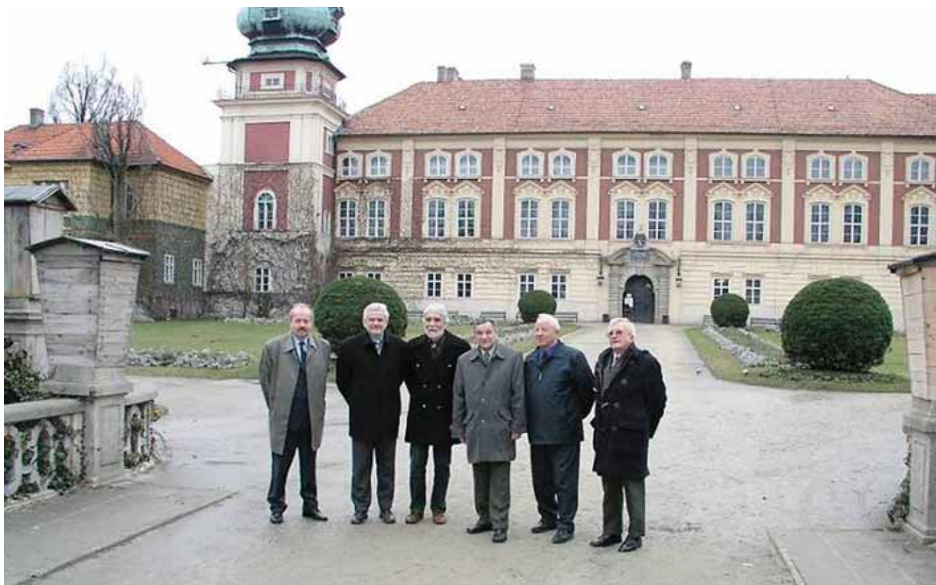
Rzeszów - 19.03.2004 r.