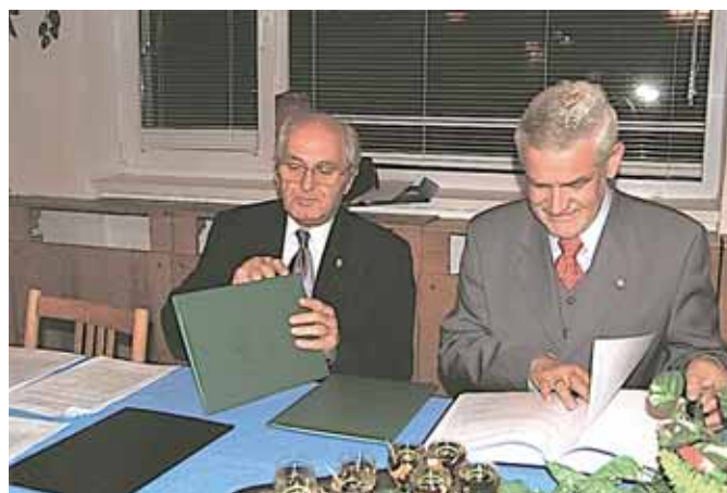
2 września 2006 r. w Opatce na Słowacji podpisano umowę o współpracy ze Słowacką Izbą Inżynierów Budownictwa (SKKI) z regionu Koszyc