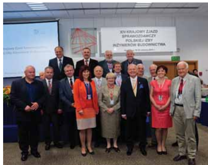
XIV Zjazd 2015 r.