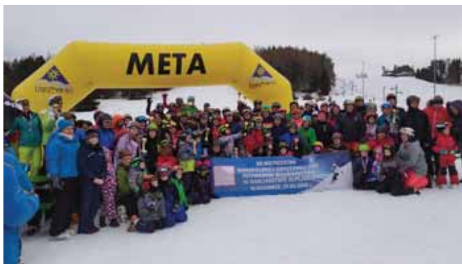
Kluszkowce, 2020 r.