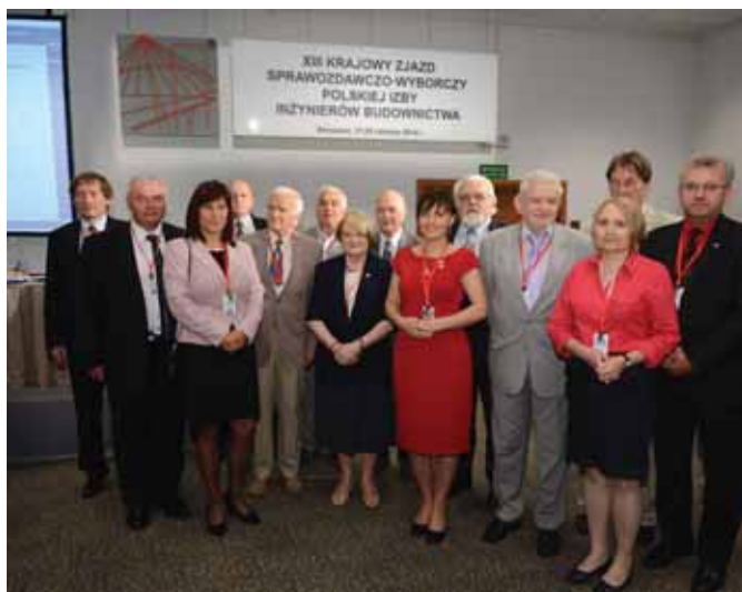
XIII Zjazd 2014 r.