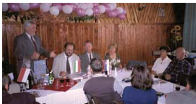
28-30 września 2000 Niedzica