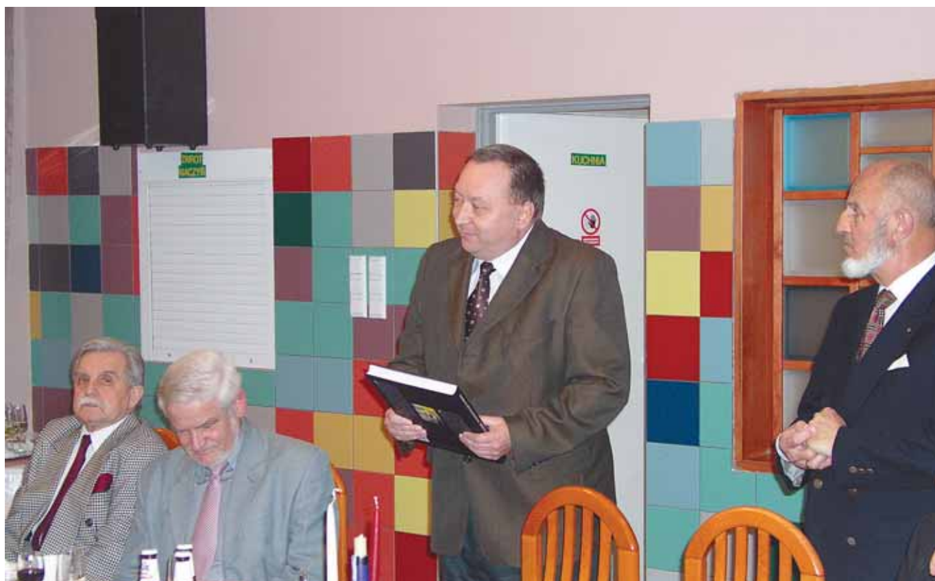
Szkolenie OROZ i OSD z Polski południowej - Sucha Beskidzka 16-18.10.2008 r.

Podstawę prawną prowadzenia postępowań w zakresie odpowiedzialności zawodowej i dyscyplinarnej członków samorządów w budownictwie stanowiła nie tylko Ustawa o samorządzie zawodowym architektów, inżynierów budownictwa oraz urbanistów, ale także Rozporządzenie ministra infrastruktury w sprawie szczegółowych zasad i trybu postępowania dyscyplinarnego w stosunku do członków samorządów zawodowych architektów, inżynierów budownictwa oraz urbanistów. W 2006 roku został uchwalony