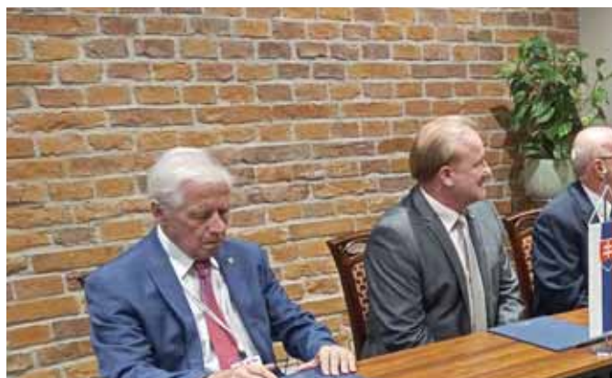
19-22 sierpnia 2021 Kraków