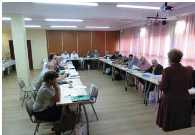
Wyjazdowe zebranie ZP MOIIB – Dobczyce, 10-11.10.2014 r.