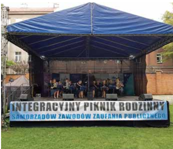
Piknik zawodów Zaufania Publicznego 7.09.2019 r.