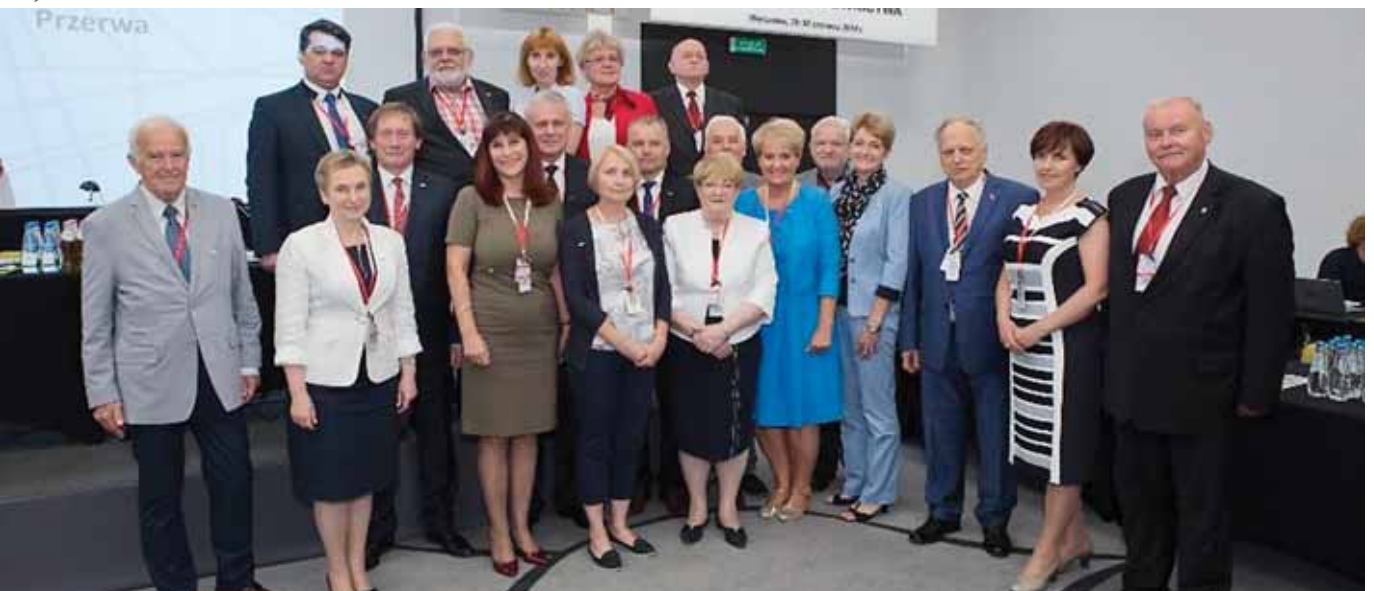
XVII Zjazd 2018 r.