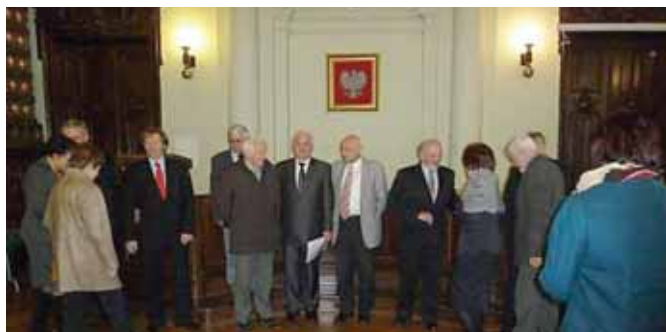
Otwarcie nowego PI w Nowym Sączu 22.03.2012 r.

W PI prowadzone są dyżury członków Okręgowej Komisji Kwalifikacyjnej oraz Rzecznika Odpowiedzialności Zawodowej. Corocznie organizowane były imprezy integracyjne dla członków MOIIB oraz dla członków Małopolskiej Okręgowej Izby