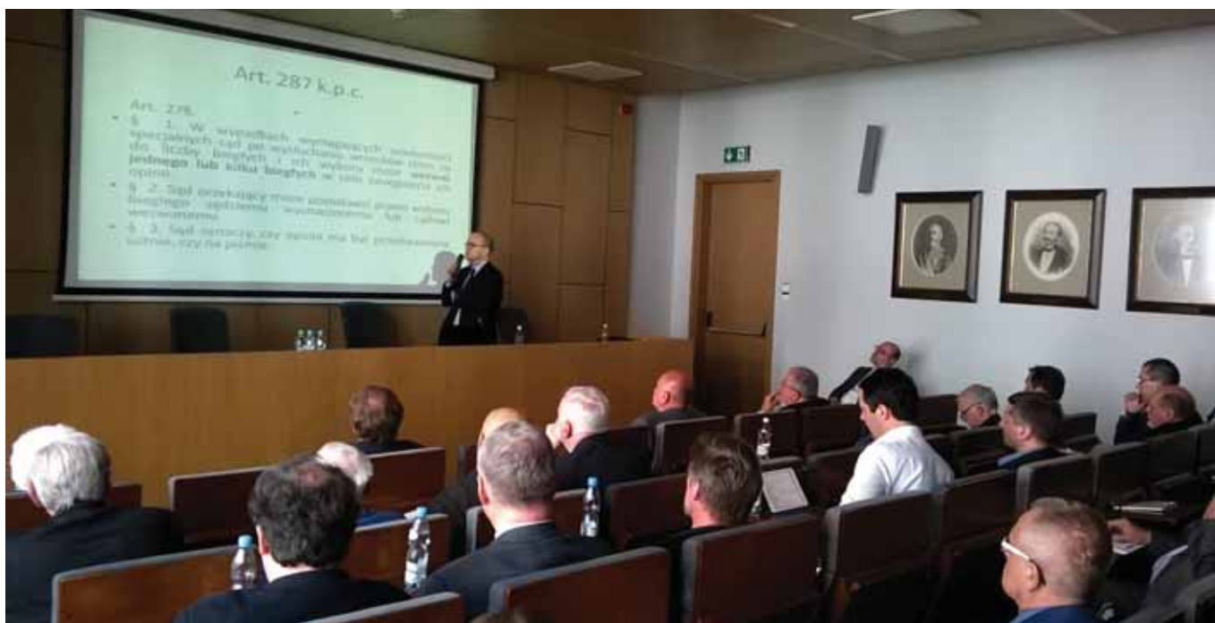
III Seminarium w Sądzie Apelacyjnym w Krakowie w dniu 06.04.2017 r.