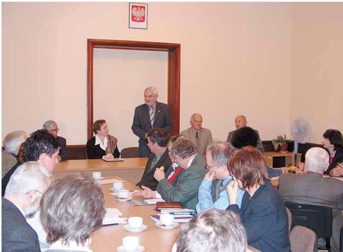
Spotkanie z przedstawicielami Wydziału Infrastruktury Urzędu Wojewódzkiego i Wydziału Rozwoju Regionalnego w Krakowie - 14.12.2004 r.