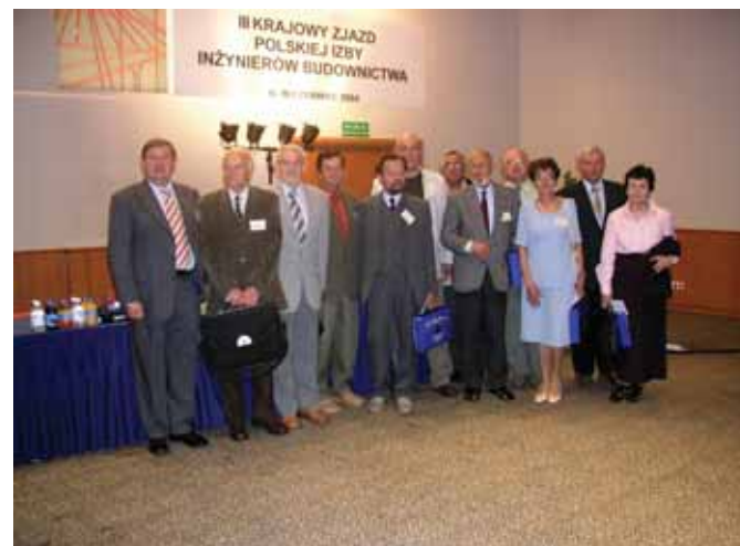
III Zjazd 2004 r.