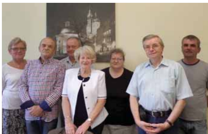
Członkowie OKR IV kadencji

Z każdej kontroli przeprowadzonej przez OKR sporządzane były protokoły, które zawierały wnioski i zalecenia. Przekazywane były wraz z podejmowanymi uchwałami przewodniczącemu Okręgowej Rady oraz przewodniczącemu Krajowej Komisji Rewizyjnej.