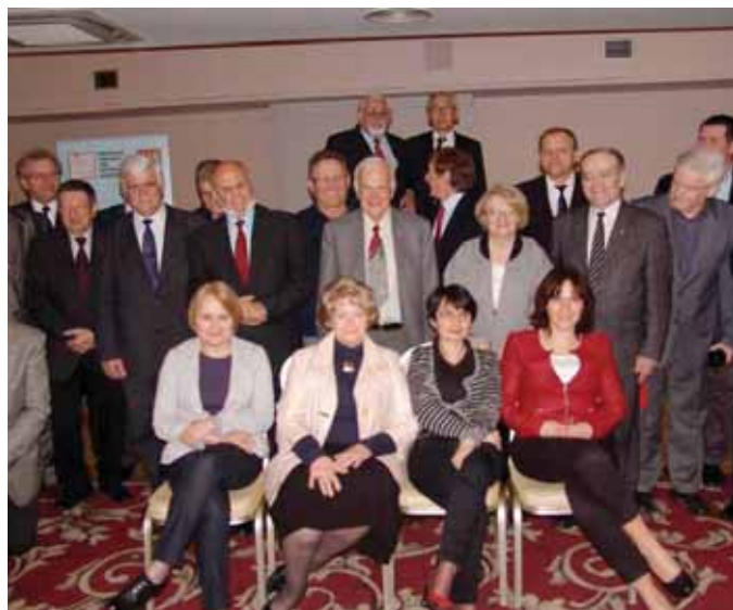
Rada MOIIB – Muszyna, 21-22.04.2014 r.