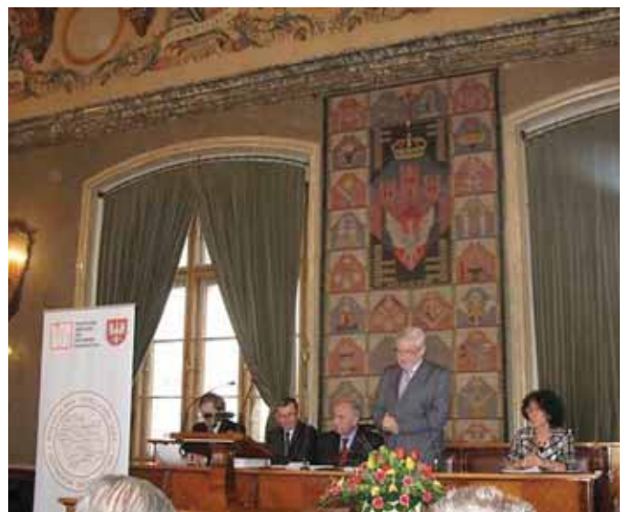
Rada MOiIB – Urząd Miasta Krakowa, 15.03.2010 r.