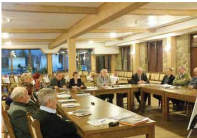
Wyjazdowe zebranie OKK - Sromowce 26-27.10.2012 r.