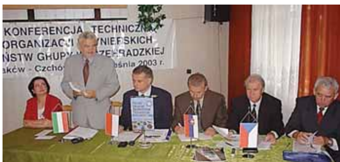
4-7 września 2003 r. Czchów Konferencja „Drogi wodne i obiekty hydrotechniczne na rzekach państw Grupy Wyszehradzkiej oraz informacja w budownictwie w krajach V-4”