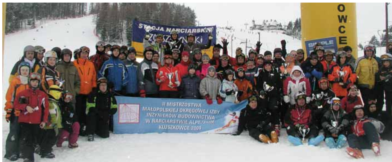
Kluszkowce, 2009 r.