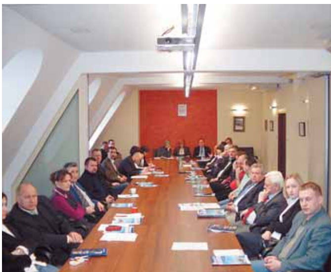
Spotkanie z powiatowymi inspektorami nadzoru budowlanego - 9.03.2010 r.