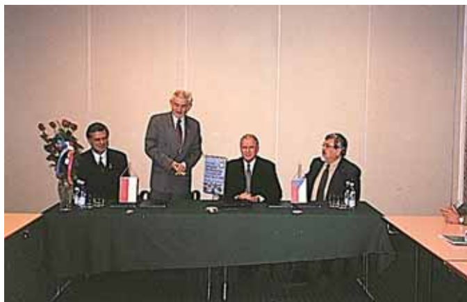
25 listopada 2002 r. w Krakowie podpisano umowę o współpracy z Czeską Izbą Autoryzowanych Inżynierów i Techników (CKAIT) i Czeskim Związkiem Inżynierów Budownictwa (CSSI) z regionu Ostrawa

Organizowane od 21 lat spotkania (spotkanie w 2020 r. nie doszło do skutku ze względu na sytuację epidemiczną w Europie związaną z COVID-19) są okazją do wymiany doświadczeń i poglądów na temat aktualnej sytuacji związków i izb budowlanych oraz dyskusji o sprawach budownictwa w poszczególnych regionach w krajach Grupy Wyszehradzkiej V4. Spotkania są także okazją do wymiany czasopism i wydawnictw związanych z działalnością tych organizacji oraz poznawania interesujących obiektów budowlanych oraz zabytków kultury i sztuki. Kontakty nawiązane w trakcie tych spotkań są kontynuowane nie tylko w okresie corocznych spotkań, ale również przez cały rok przy okazji różnych imprez i uroczystości, na które zapraszane są delegacje tych organizacji.