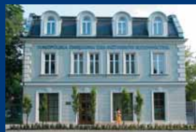
Siedziba Małopolskiej Okręgowej Izby Inżynierów Budownictwa przy ul. Czarnowiejskiej w Krakowie

Biuletyn MOIIB „Budowlani” dostępny jest także w wersji elektronicznej na stronie www.map.piib.org.pl