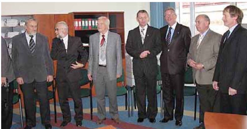
Uroczyste otwarcie obecnej siedziby PI w Tarnowie 09.11.2010 r.