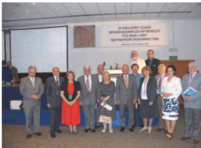
IX Zjazd 2010 r.

Przedstawiciele Krajowej Rady w osobie prezesa, wiceprezesa lub członka Prezydium KR PIIB uczestniczyli w corocznie organizowanych Zjazdach Sprawozdawczych i co 4 lata Zjazdach Sprawozdawczo-Wyborczych MOIIB.