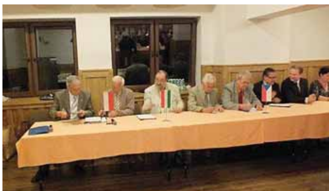
30.08-02.09.2012 r. Sromowce Niżne Konferencja „Budowa obiektów sakralnych w krajach Grupy V-4”