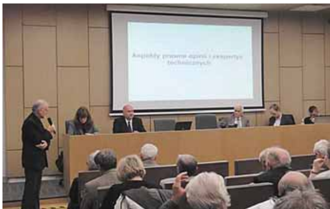
I Seminarium w Sądzie Apelacyjnym w Krakowie w dniu 15.10.2013 r.

W ramach współpracy władz MOIIB z przedstawicielami Sądu Apelacyjnego uznano za celowe organizowanie cyklicznych seminariów dla biegłych sądowych i rzeczoznawców budowlanych. Dotychczas zorganizowane zostały trzy seminaria nt. „Metodologia opracowywania opinii i ekspertyz w budownictwie dla potrzeb postępowań sądowych” (15.10.2013 r., 29.06.2015 r. i 06.04.2017 r.).