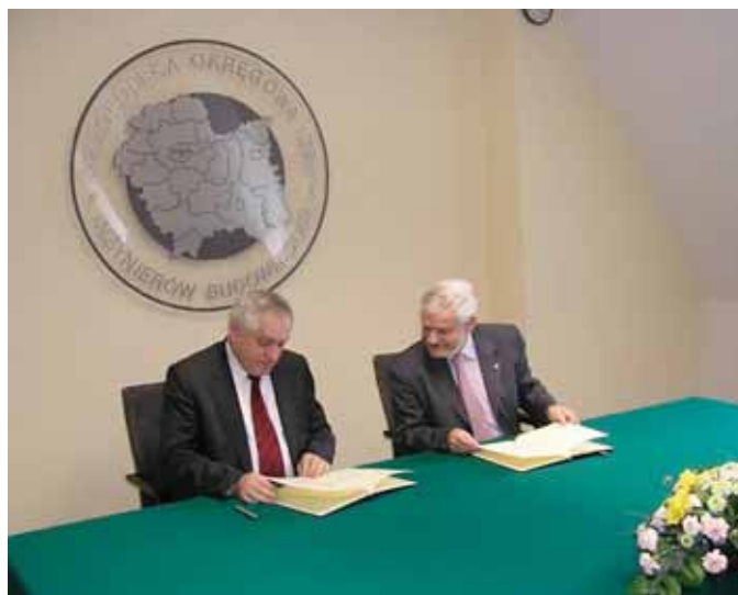
Podpisanie umowy o współpracy z Politechniką Krakowską 13.03.2009 r.

MOIIB pełniła honorowy patronat nad Krakowskimi Targami Budowlanymi, w ramach których organizowano Dzień Inżyniera Budownictwa.