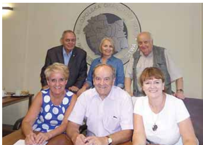
Członkowie ZP ds. Ustawicznego Doskonalenia Zawodowego