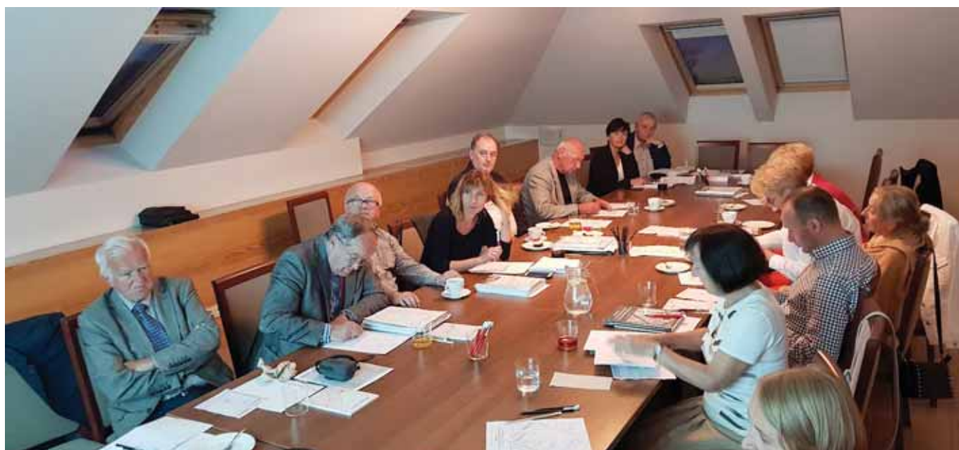
Wyjazdowe zebranie ZP MOIIB – Jerzmanowice, 20-21.09.2019 r.