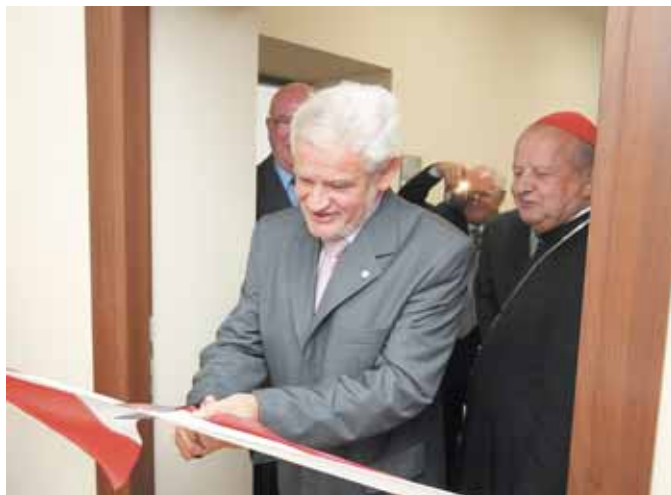
Otwarcie siedziby MOIIB – 03.09.2007 r.

W poszczególnych kadencjach organizowane były spotkania z przedstawicielami organów administracji architektoniczno-budowlanej Małopolskiego Urzędu Wojewódzkiego w Krakowie, z powiatowymi inspektorami nadzoru budowlanego, reprezentantami Państwowej Inspekcji Pracy oraz stowarzyszeniami naukowo-technicznymi branży budowlanej.