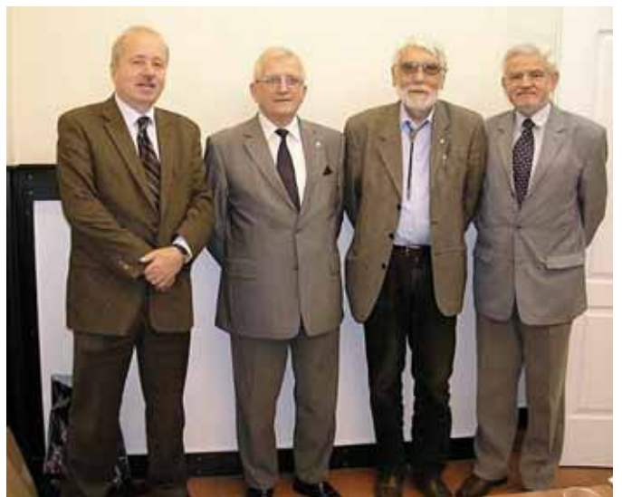
Katowice - 04-05.06.2009 r.