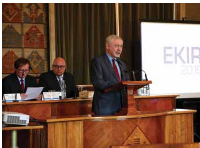
Otwarcie konferencji EKIR 2020 - 01.04.2019 r.