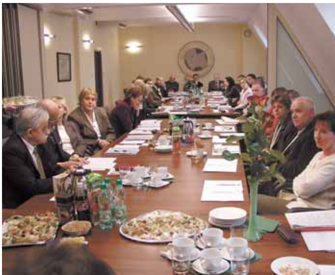
Spotkanie z administracją architektoniczno-budowlaną ze starostw powiatowych - 14.11.2007 r.