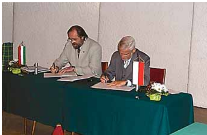
25 września 2004 r. w Zakopanem podpisano umowę o współpracy z Regionalną Izbą Inżynierów B-A-Z Bomek z Miskolca