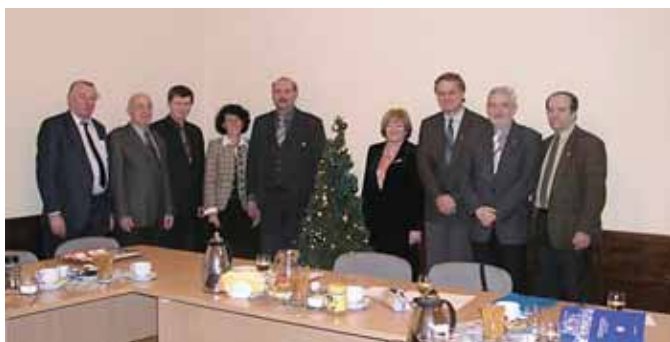
Spotkanie z przewodniczącymi Oddziałów SNT NOT - 27.01.2005 r.