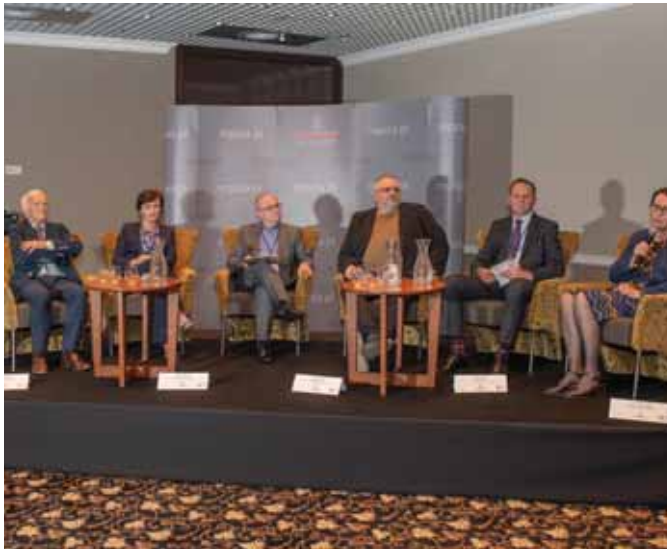
Konferencja Architektów w Krynicy - 15-16.11.2019 r.