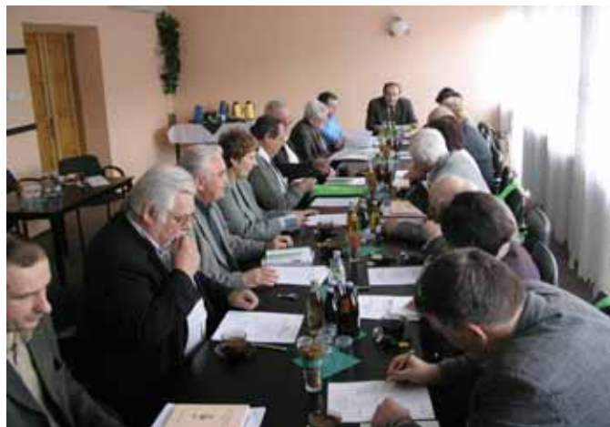
Wyjazdowe zebranie ZP MOIIB – Dobczyce, 26-27.03.2010 r.

Dobrym zwyczajem przyjętym od kilku lat była organizacja dwudniowych wyjazdowych seminariów dla członków wszystkich Zespołów, które – oprócz roli szkoleniowo-informacyjnej – odgrywały ważną rolę integracyjną i cieszyły się dużym zainteresowaniem członków Zespołów Problemowych.