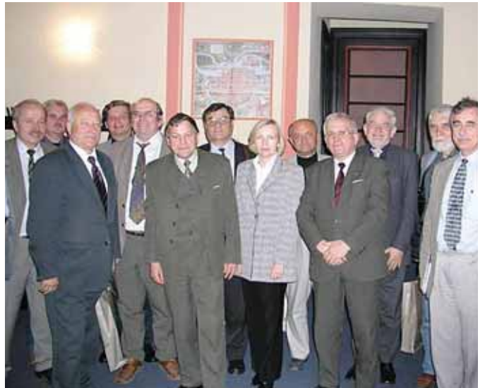
Wrocław - 13.05.2005 r.