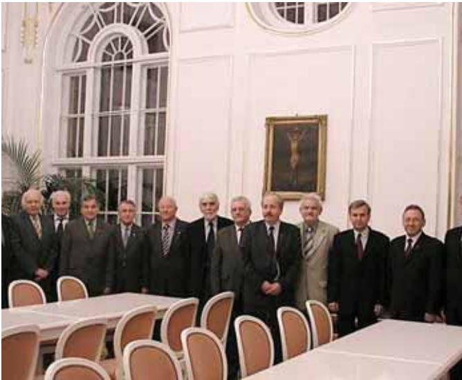
Opole - 21-22.10.2005 r.