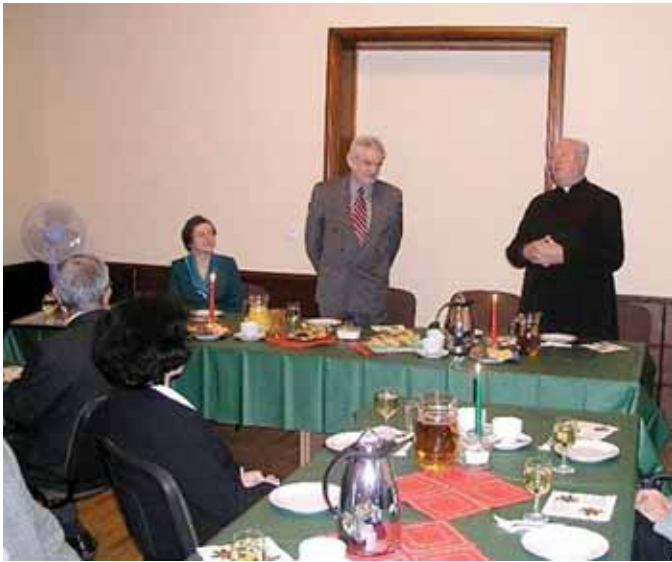
Rada MOiIB – Kraków, 15.12.2003 r.