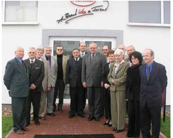
Kielce - 10-11.09.2006 r.