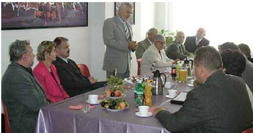
Spotkanie z władzami miasta Tarnowa - 08.09.2004 r.

PI w Tarnowie był współorganizatorem wielu szkoleń seminaryjnych organizowanych przez Oddział Tarnowski SEP oraz TJO FSNT NOT w Tarnowie. Ważnym wydarzeniem w życiu PI w Tarnowie był współdziałanie w zorganizowaniu obchodów 180. rocznicy założenia pierwszego polskiego stowarzyszenia technicznego przez tarnowianina gen. inż. Józefa Bema.