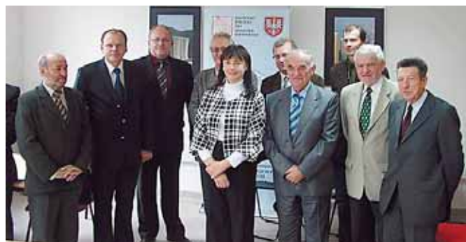
Otwarcie PI w Oświęcimiu – 27.10.2009 r.

Działalność Punktu Informacyjnego w Oświęcimiu nakierowana jest na obsługę członków MOIIB, a także osób zainteresowanych zdobyciem uprawnień budowlanych z powiatów oświęcimskiego, wadowickiego i chrzanowskiego. Szczególnym zainteresowaniem członków MOIIB cieszą się szkolenia