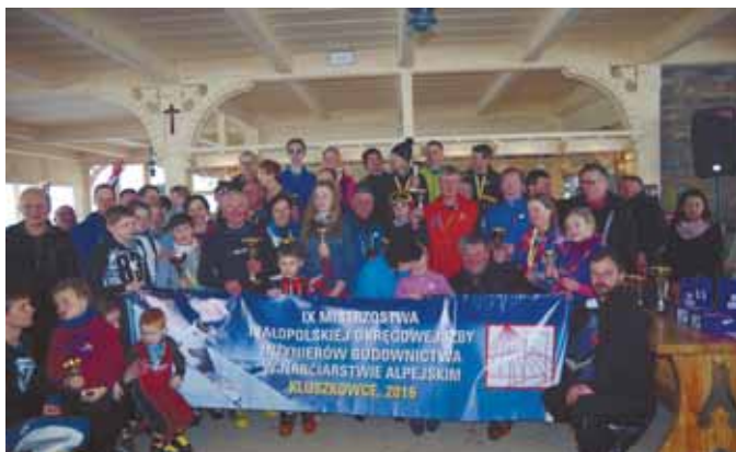
Kluszkowce, 2016 r.