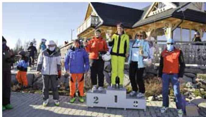
Kluszkowce, 2021 r.