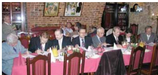
4-6 września 2009 r. Kraków Konferencja „Proces nadawania uprawnień budowlanych w krajach Grupy Wyszehradzkiej”