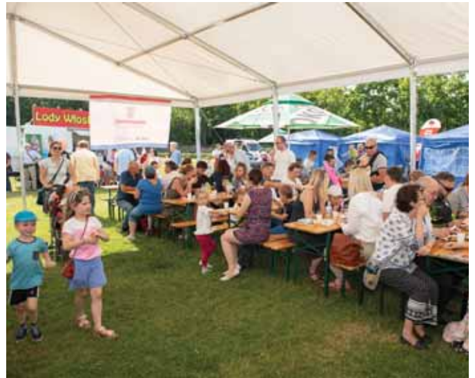
Piknik architektoniczno-budowlany 6.07.2019 r.