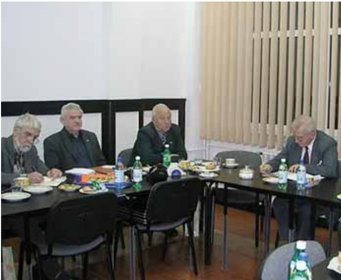
Katowice - 19.11.2004 r.