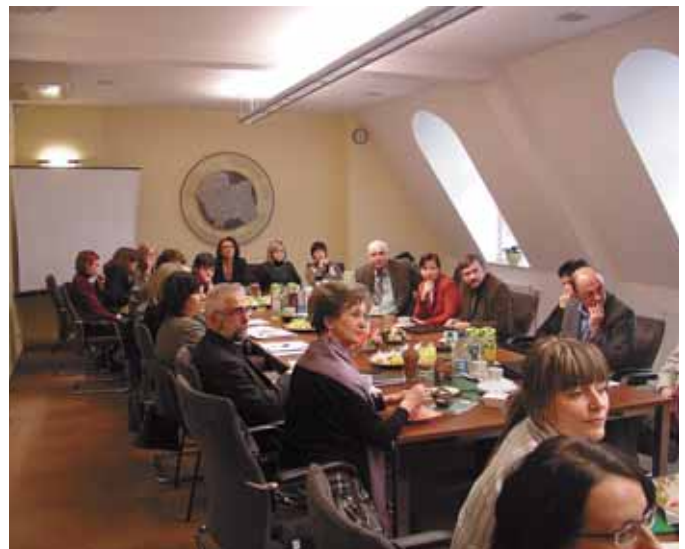
Spotkanie z administracją architektoniczno-budowlaną ze starostw powiatowych - 26.11.2008 r.