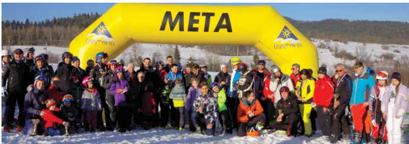
Kluszkowce, 2019 r.