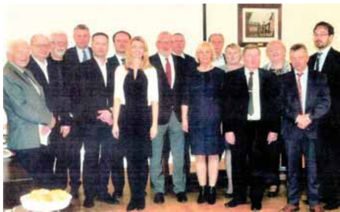
Spotkanie przedstawicieli Małopolskiego Forum Samorządów Zawodów Zaufania Publicznego, 27.03.2017.

W marcu 2008 roku Rada MOIIB podjęła pierwsze działania dla utworzenia Małopolskiego Forum Samorządowego, które zostały uwieńczone podpisaniem 22 marca 2017 roku porozumienia 14 małopolskich organizacji samorządowych, tworząc Forum Samorządów Zawodów Zaufania Publicznego. Jako pierwsza przewodnictwem Forum objęła Okręgowa Izba Lekarska w Krakowie. Przewodnictwo zmienia się rotacyjnie, co 6 miesięcy.