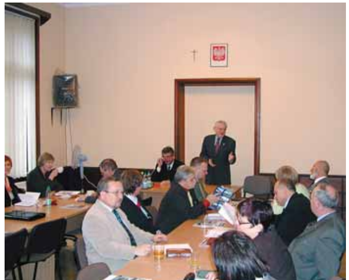
Spotkanie z powiatowymi inspektorami nadzoru budowlanego - 19.12.2006 r.