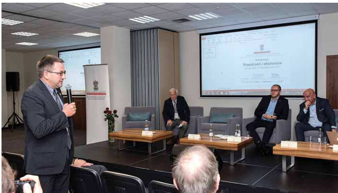
Konferencja architektów w Krynicy - 27-28.10.2017 r.