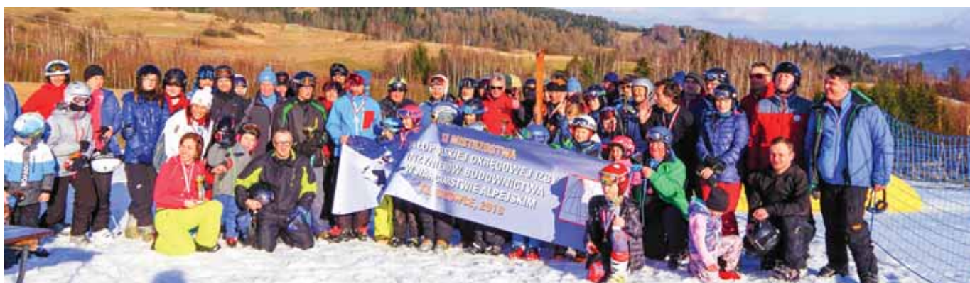
Kluszkowce, 2018 r.