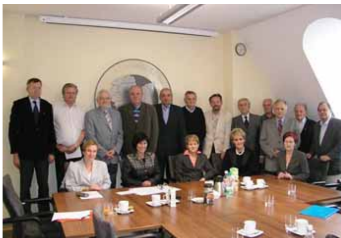
Członowie OKK w III kadencji