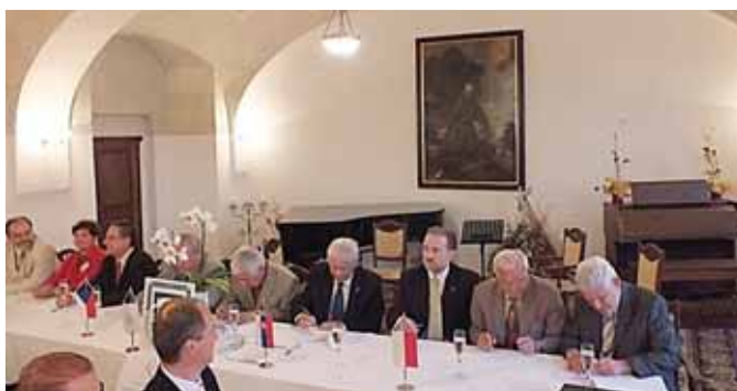
2 września 2011 r. w Skalicy na Słowacji podpisano umowę o współpracy ze Słowacką Izbą Inżynierów Budownictwa z regionu Koszyce/Preszow oraz regionu Trnawa, Słowackim Związkiem Inżynierów Budownictwa - Oddział Koszyce, Czeską Izbą Autoryzowanych Inżynierów i Techników oraz z Czeskim Związkiem Inżynierów Budownictwa z regionu Karlowe Wary, Czeską Izbą Autoryzowanych Inżynierów z regionu Ostrawa oraz Regionalną Izbą Inżynierów B-A-Z Bomek w Miskolcu