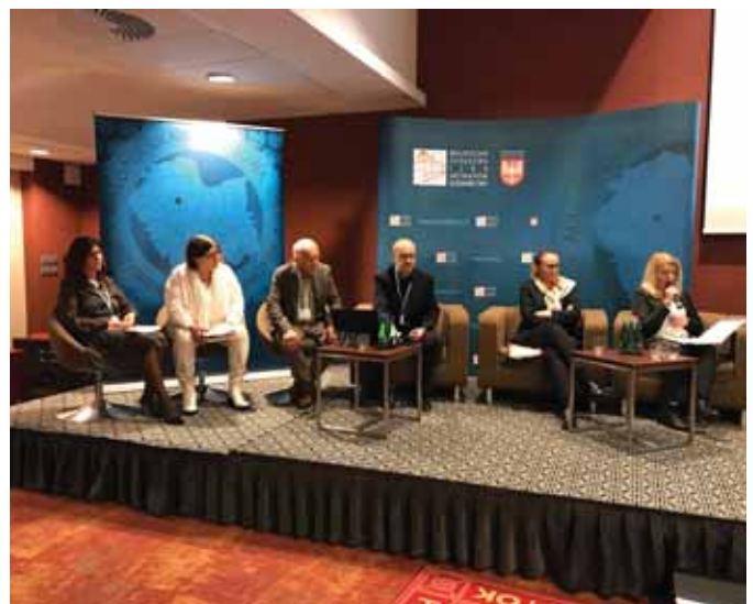
Warsztaty z administracją architektoniczno-budowlaną i nadzorem - Wisła, 26-28.10.2021 r.