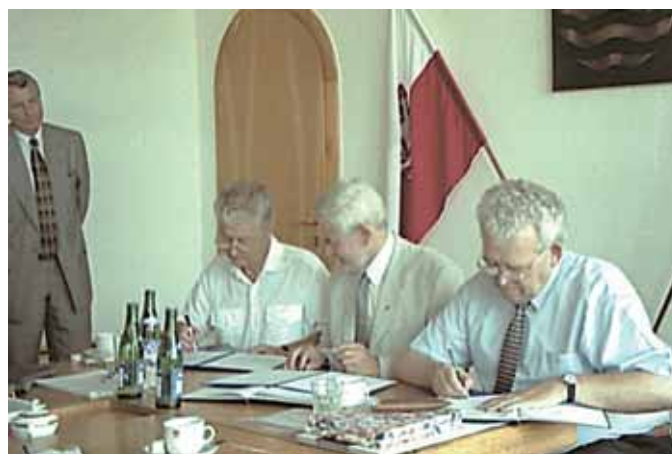
2 września 2005 r. w Mariáňskiej w Czechach podpisano umowę o współpracy z Czeską Izbą Autoryzowanych Inżynierów i Techników (CKAIT) z regionu Karlowe Wary