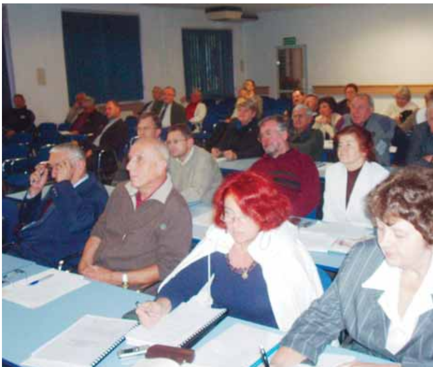
Szkolenie Sucha Beskidzka, 12-13.10.2007

Sprawy wnoszone do OROZ tradycyjnie już od wielu lat najczęściej toczą się wobec członków PIIB, którzy pełnią następujące samodzielne funkcje techniczne: kierownika budowy, inspektora nadzoru, autorów projektu i projektantów sprawdzających, sporządzających opinie techniczne i przeglądy okresowe i rzeczoznawców. Pandemia w latach 2020-21 bardzo skomplikowała prowadzenie postępowań. Wiele zaplanowanych wcześniej czynności należało przekładać na inne terminy, nie mając pewności, czy możliwe będzie prowadzenie przesłuchań stron i świadków. Mimo niezależnych od organu OROZ okoliczności, udało się przy pełnej współpracy koleżanek i kolegów Rzeczników tak zorganizować jego pracę, by każda sprawa skierowana do rozpatrzenia została załatwiona w terminie, zgodnie z obowiązującymi przepisami.