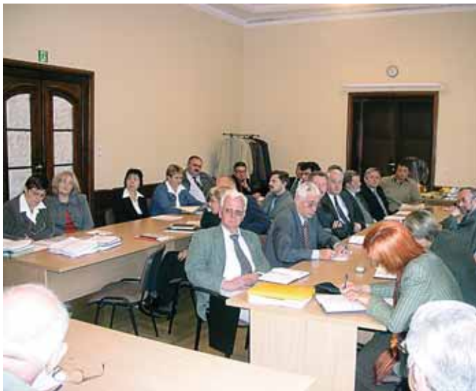
Spotkanie z powiatowymi inspektorami nadzoru budowlanego - 29.09.2004 r.