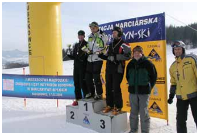
Kluszkowce, 2008 r.

Zawody w narciarstwie alpejskim pełnią ważną rolę integracyjną. Organizatorzy zawodów corocznie dbali, aby zapewnić uczestnikom ciepły poczęstunek i możliwość wspólnych rozmów i wymiany poglądów. Zawody weszły na stałe do kalendarza imprez sportowych organizowanych przez Radę MOIIB na początku roku.