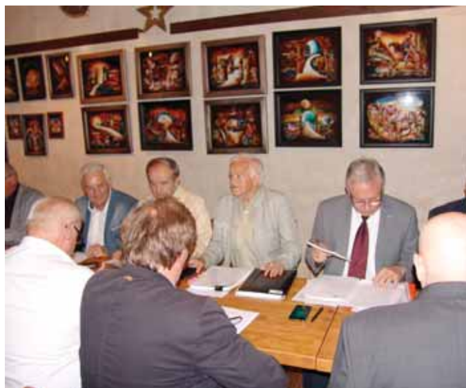
Rada MOIIB – Zubrzyca Górna, 11-12.09.2017 r.