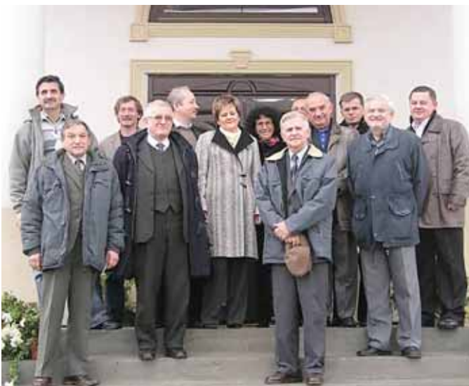
Kraków - 26-27.10.2007 r.