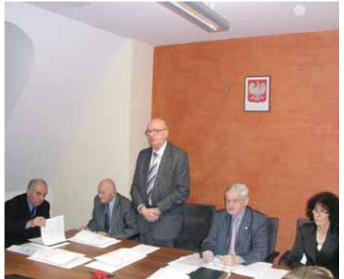
Rada MOiIB – Kraków, 20.12.2007 r.