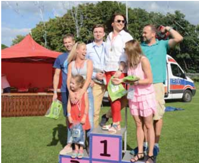
Piknik architektoniczno-budowlany 7.07.2018 r.