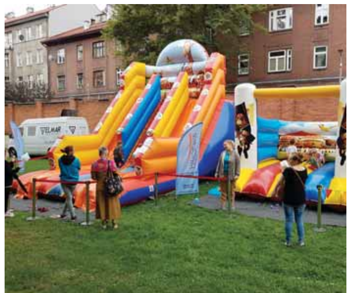
Piknik zawodów Zaufania Publicznego 7.09.2019 r.