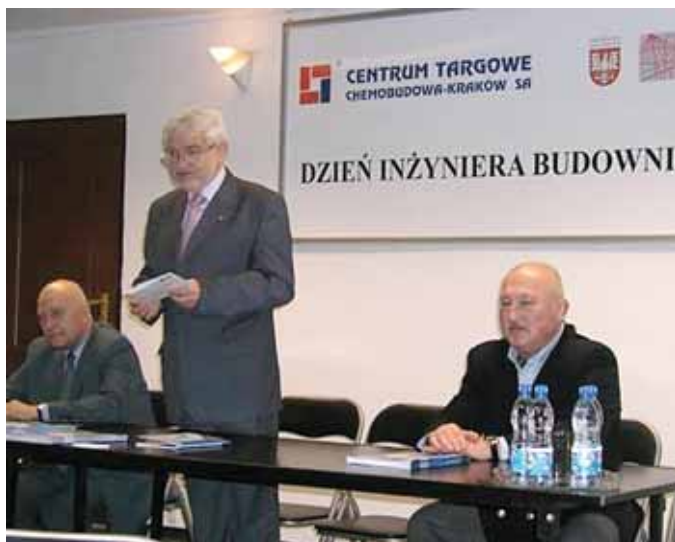
Dzień Inżyniera Budownictwa 17.04.2008 r.