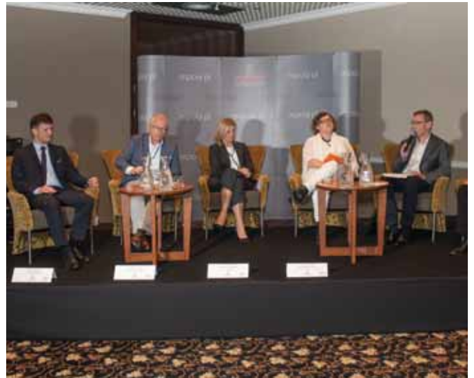
Konferencja Architektów w Krynicy - 15-16.11.2019 r.