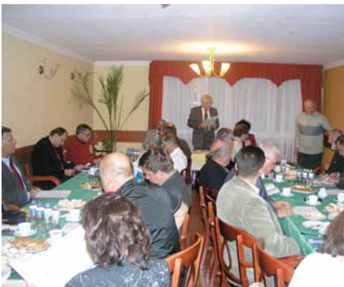
Rada MOiIB – Zawoja, 03.10.2008 r.