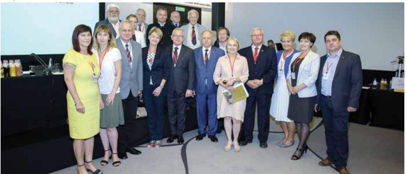
XVIII Zjazd 2019 r.