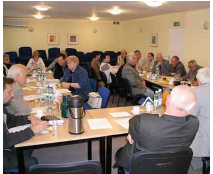
Rada MOiIB – Niedzica, 10.06.2005 r.