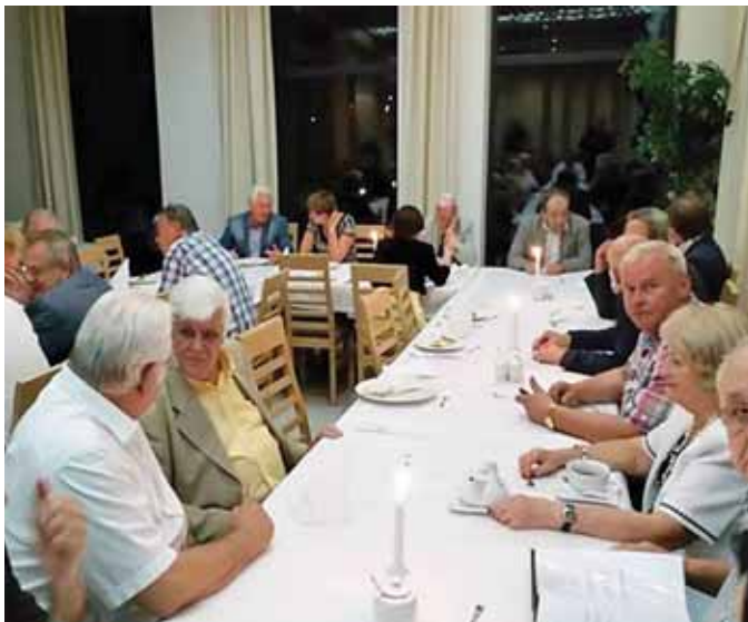
Rada MOIIB – Bachledówka, 18-19. 09.2015 r.