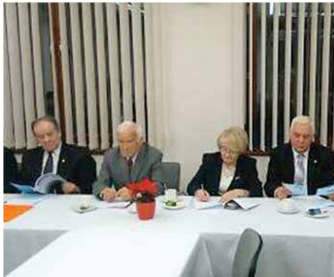
Rada MOIIB – Kraków, Centrum JP II, 15.12.2015 r.