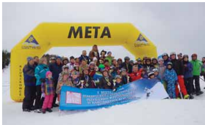
Kluszkowce, 2017 r.