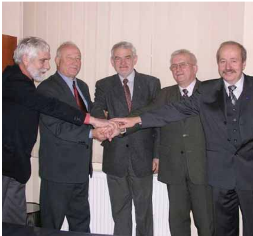
Kraków - 05.12.2003 r.

Przedstawiciele MOIIB brali udział w imprezach o charakterze sportowo-rekreacyjnym organizowanych przez inne izby okręgowe. Również przedstawiciele innych izb okręgowych uczestniczyli w imprezach naukowo-technicznych oraz sportowo-rekreacyjnych organizowanych przez MOIIB.