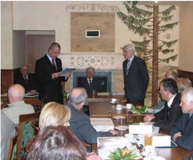
Rada MOiIB – Zakopane, 24.03.2006 r.