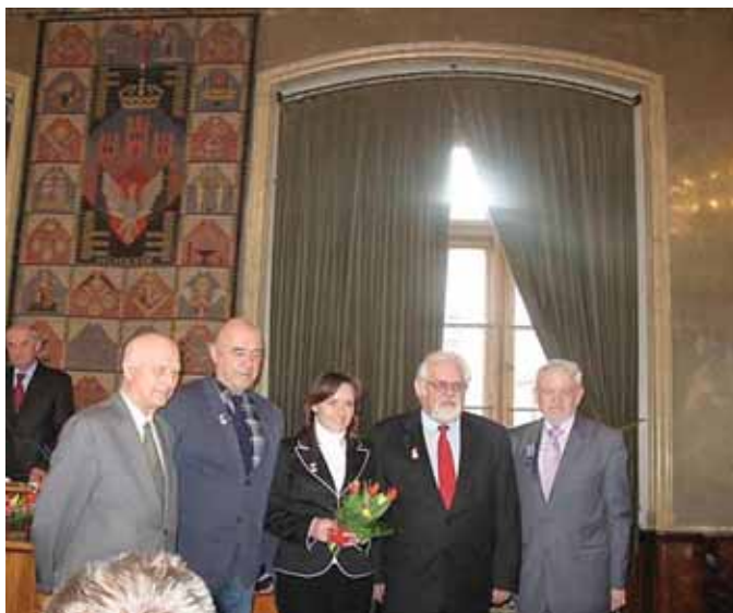
Rada MOIIB – Urząd Miasta Krakowa, 15.03.2010 r.