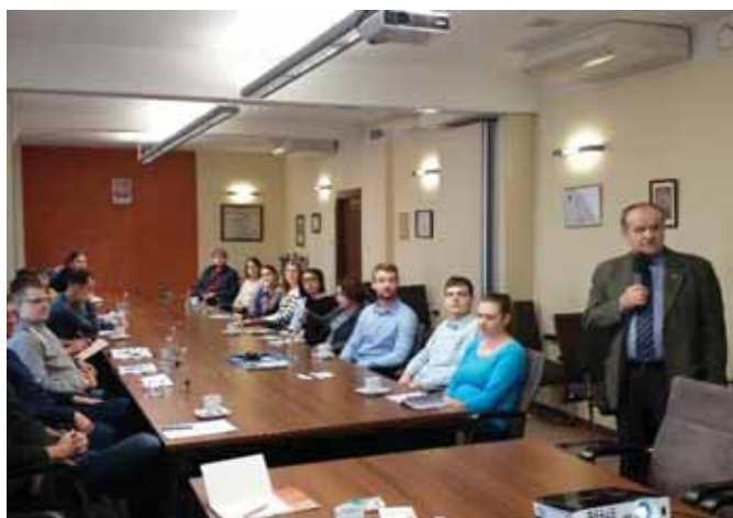
Szkolenie z zakresu BIM - Kraków 25.10.2016 r.