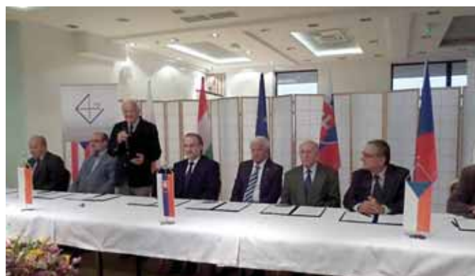
24-27 sierpnia 2017 r. Bachledówka k. Zakopanego Konferencja „Budownictwo regionalne i sakralne w krajach Małej Grupy Wyszehradzkiej”